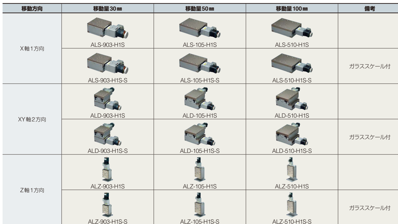
高精度高剛性ラインアップ表

移動量30mm、50mm、100mmの3種類を軸に全18機種のX,XY,Zステージを用意しています。