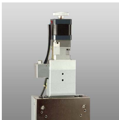
ボール減速機付きモータ仕様

これらのオプションは、製造段階での作業が伴いますので、ご注文時にお申し付け下さい。