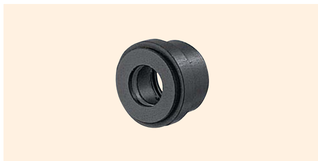
↑ MH-30-20 ~ MH-50-40 アダプタ