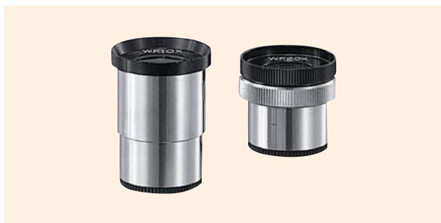
↑ OC-10 / OC-20 接眼レンズ