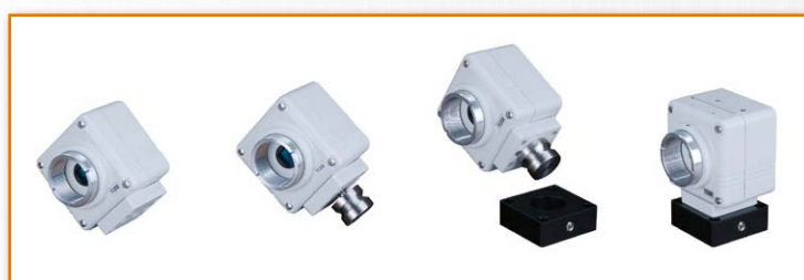
カメラ取付アダプタ 取付方法